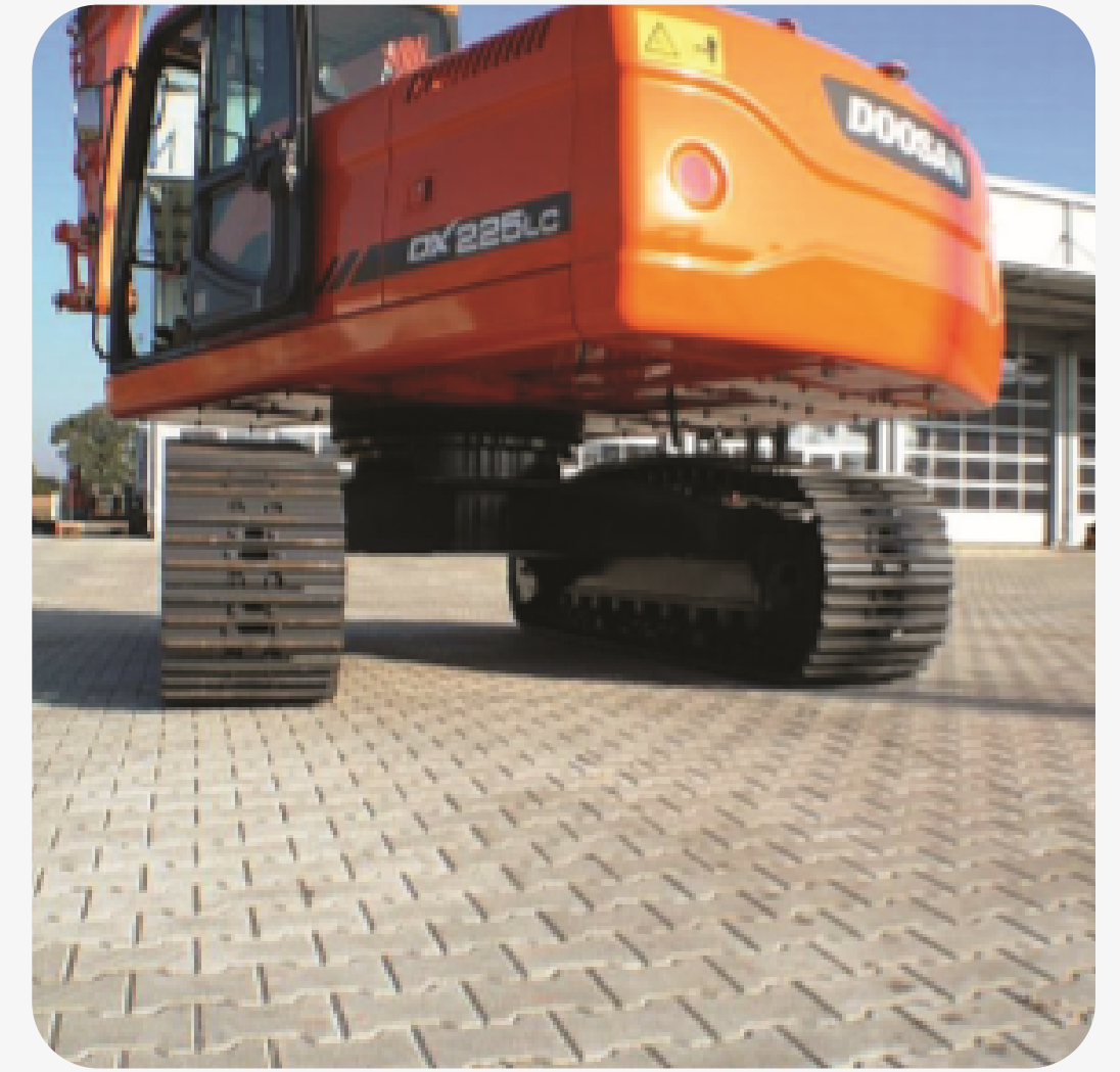
Площадка завода строительных машин "Kraemer", 2011