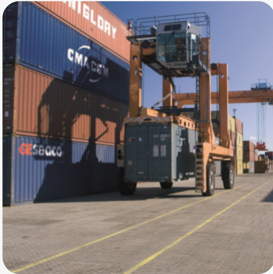
Контейнерный терминал в порту MUUGA, 2006