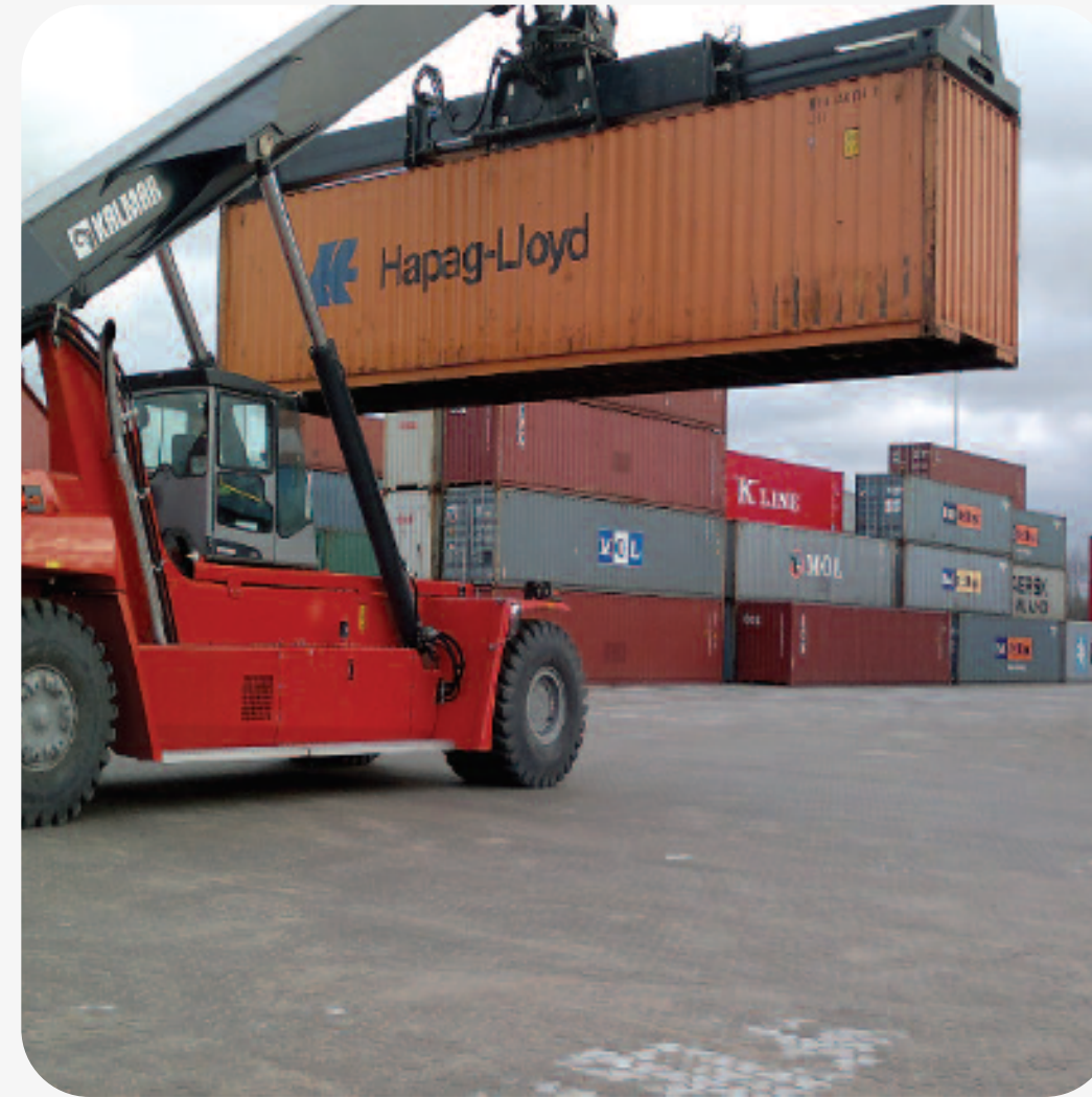
Терминал "Осиновая роща", 2012